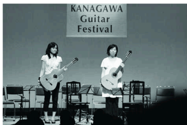
仲よく華やかに演奏