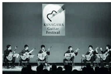
凝った編曲も軽々とこなす