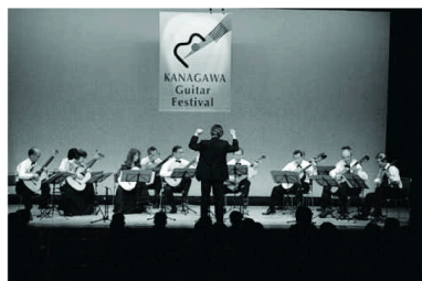
常連の安定した楽しいアンサンブル

た。特に小学生の高い技術の演奏が話題を呼んでいたようだ。委員と有志会員によるスタッフ長時間で体的にも大変であるが、コンサートを最後まで楽しく盛り上げ、サポートしていた。