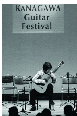
よい雰囲気での演奏でした