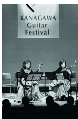
息の合った二重奏