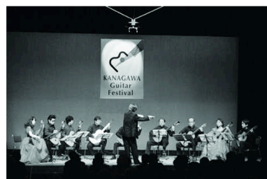
合奏プロ集団はさすがに凄い