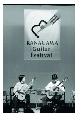
軽やかに指が動きます