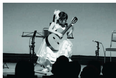
来年はどこまで上手くなるのかな