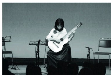
しっとりとした演奏もまた良いものです