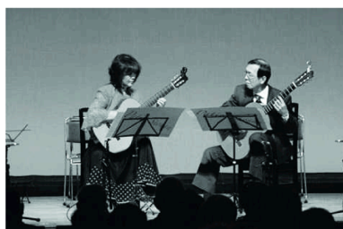
ベテランは落ち着いた雰囲気です